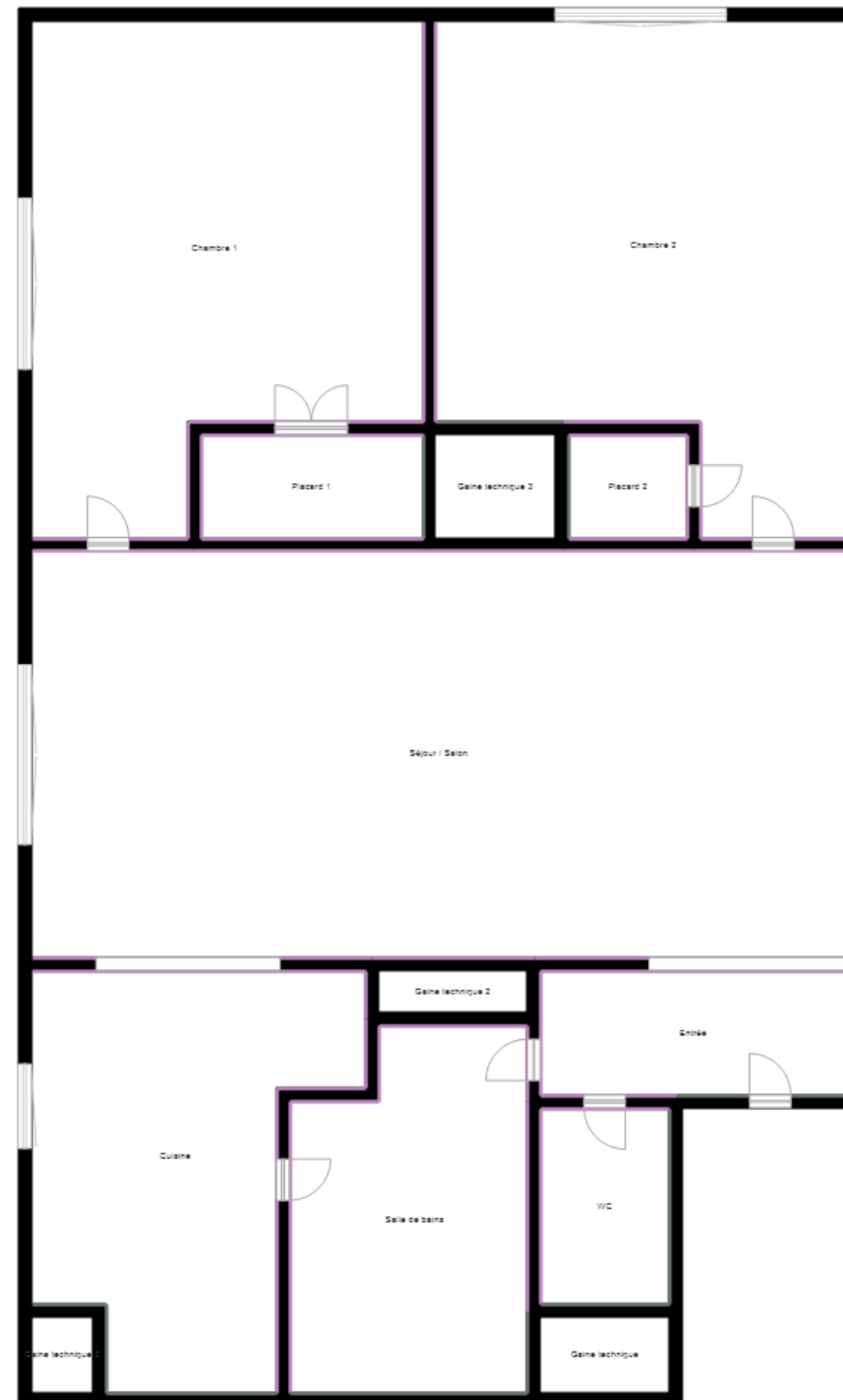
PLANCHE DE REPERAGE

Bien : 15LAB0403 - 3 5 AVENUE DE ROTHSCHILD 77400 LAGNY SUR MARNE